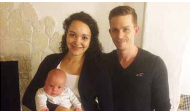
LEAN SUMMER, 11.09.2016