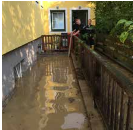
Hochwassereinsatz im Pielachtal