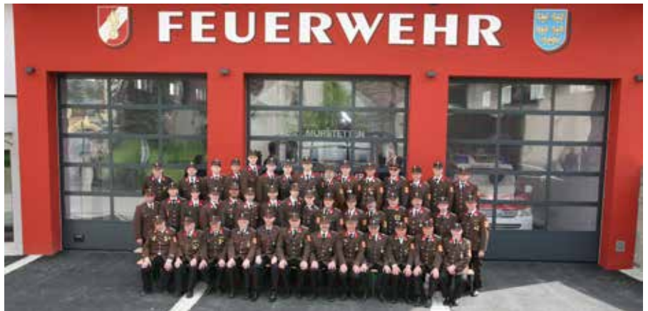
Mannschaftsfoto vor der neuen Fahrzeughalle