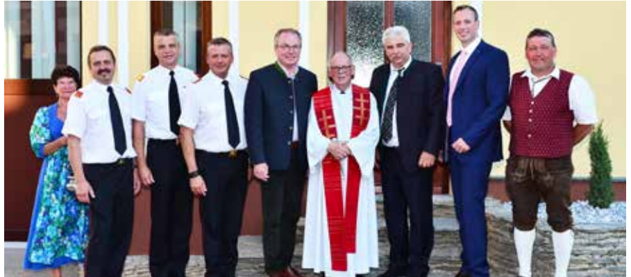
Ehrengäste bei der Eröffnung von unserem Feuerwehrhaus

Als wohl vielen noch längere Zeit im Gedächtnis bleibendes Ereignis kann der Festakt anlässlich des 125-jährigen Bestandsjubiläums und der Feuerwehrhaus-Eröffnung am 27. August beschrieben werden. An diesem Samstag-Nachmittag fanden sich neben Bevölkerung und zahlreichen, befreundeten Feuerwehren auch sämtliche für unsere Wehr zuständige Feuerwehr-Funktionäre bis hin zum Landesfeuerwehrkommandanten Dietmar Fahrafellner bei uns in Murstetten ein.