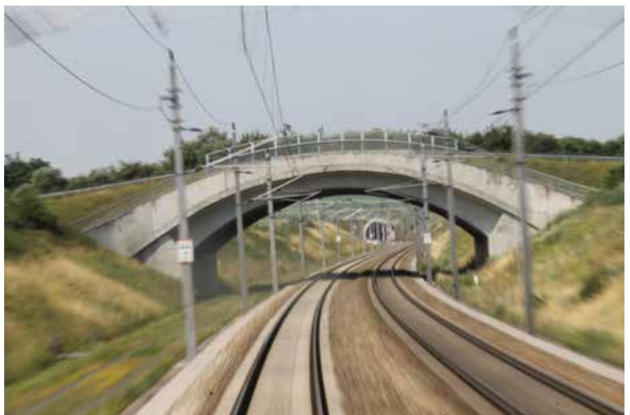
„Im Perschlingtal unter der Wildbrücke durch ...“

vergleicht in beispielhafter Form, was von der HL-AG versprochen wurde, mit dem, was schließlich realisiert wurde. Manche der befürchteten Einbußen (Grundverbrauch, Wasserverluste, Wertverluste, usw.) sind eingetreten, manche nicht. Die erwarteten Auswirkungen (optische Behübschungen, Ökoflächen, Lärm, Erschütterungen, usw.) sind vielleicht nicht so schlimm. Jeder möge sich vor Ort sein Bild machen, was durch die Arbeit der Bürgerinitiative erreicht wurde und wie das