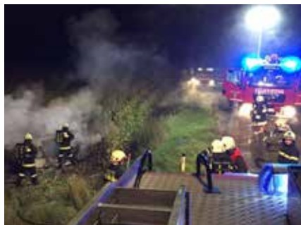
Fahrzeugbrand auf der L2223